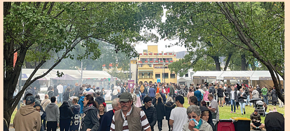
Una foto dalla Melbourne Italian Festa di ieri a Lygon Street

Un altro straordinario successo per l'edizione autunnale della Melbourne Italian Festa, lungo la celebre Lygon Street, a Carlton.